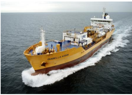
„Isabella Kosan“ – Ship of the Year 2008